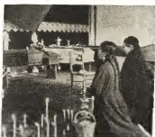
Rezando pa e victimas di Peru